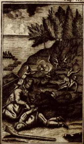
Сражение съ Дивьями.

Довле в мой храбрый Пешко на ны живо пудло, извукасамъ я ножъ изпозса и опсѣкасамъ штраницу, съ коимъ в она сѣдо жертва свезана была, подигаосамъ ю горе, кадсамъ сй нсѣ руке и ноге освобою